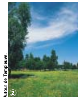
Autour de Templeuve.

Balade accessible toute l'année à la découverte de la campagne templeuvoise. La gare sert de point de départ. En période de pluie, les chemins agricoles et en bordure de zones humides nécessitent le port de chaussures étanches. Meilleure période d'avril à octobre.