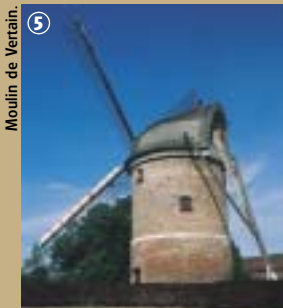
Moulin de Vertain.