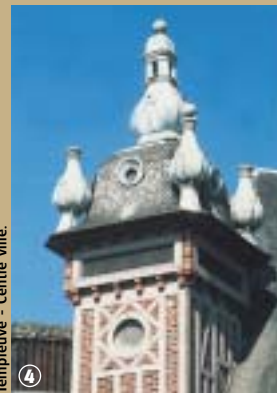
Templeuve - Centre ville.

Aujourd'hui Templeuve, bourgade mi-rurale mi-urbaine, est devenue une commune résidentielle. Ses routes pavées encore préservées accueillent en avril les cyclistes du Paris-Roubaix. Son moulin-tour à vent, le Moulin de Vertain n'en finit pas de déployer ses ailes depuis 1328, date à laquelle il est mentionné dans les rentes de l'abbaye de Tournai.