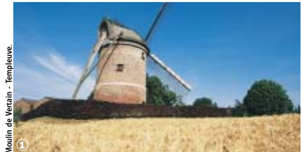
Moulin de Vertain - Templeuve.

Sur les chemins de campagne de la Pévèle, du Mélantois et de la Haute-Deûle