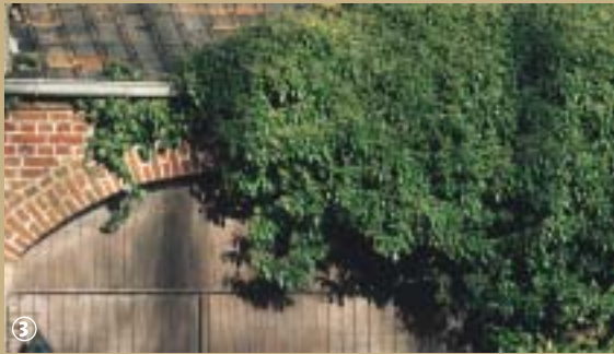
Templeuve - Porche de ferme.

Si les sorciers ont aujourd'hui les traits d'un gentil garçon à lunettes au regard malicieux, il en était autrement aux XV e , XVI e et XVII e siècles. A cette époque, les sorciers et surtout sorcières étaient des êtres machiavéliques, serviteurs du diable, aux pouvoirs dévastateurs – tout au moins le croyait-on – qu'il fallait anéantir, mais à quel prix ?