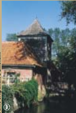
Ferme d'Aigremont à Ennevelin.

Ennevelin présente comme intérêt touristique la Ferme d'Aigremont, seul vestige du puissant domaine d'Aigremont. Dès le XII e siècle, la famille d'Aigremont édifie un château, qui, après, moult modifications, est finalement détruit en 1794. Seuls subsistent aujourd'hui un porche en forme de tour-pigeonnier, symbolisant la puissance des seigneurs puisque la propriété d'un pigeonnier était autrefois un droit réservé à la noblesse, ainsi que la ferme. Ce domaine, qui dispose encore d'un pont-levis, installé à proximité de la Marque, a conservé un charme pittoresque et champêtre, qui sied parfaitement au magasin de décoration ainsi qu'au petit estaminet, qui occupent désormais les lieux. La rivière n'est pas étrangère à