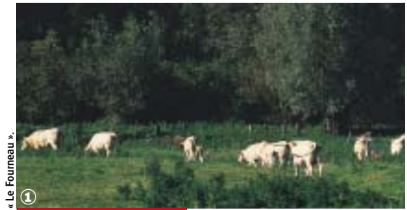
« Le Fourneau »

Sur les chemins de campagne de la Pévèle, du Mélandois et de la Haute-Deûle