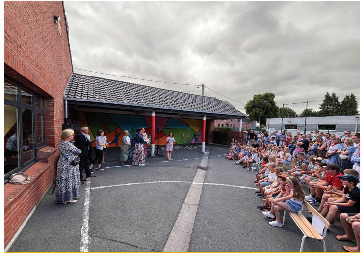
Kermesse de l'AIPE le 28 juin