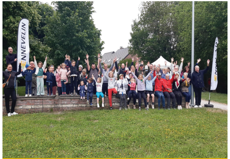
Parcours du coeur le dimanche 18 mai