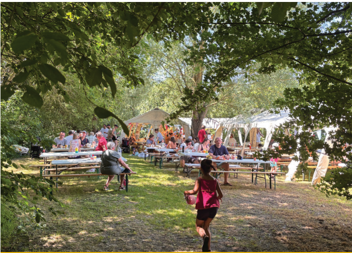
Fête du village le samedi 21 juin