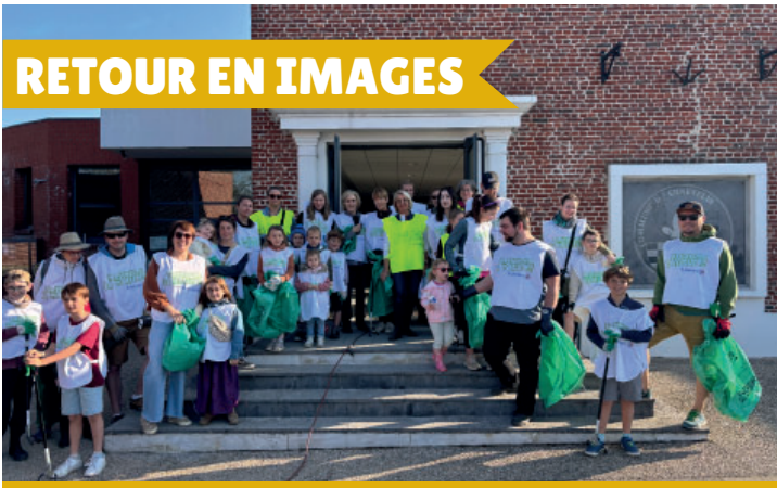
Opération «village propre» le samedi 5 avril