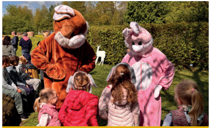
Chasse aux oeufs le lundi 21 avril