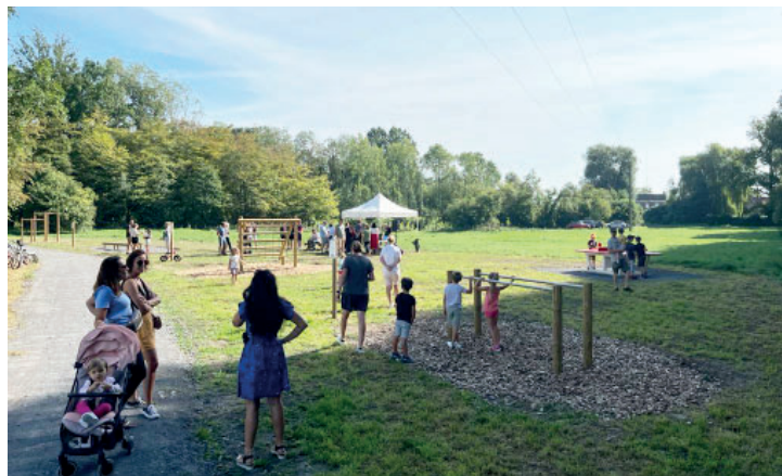
Inauguration du parcours sportif le 16 septembre