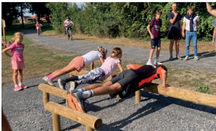
Inauguration du parcours sportif le 16 septembre