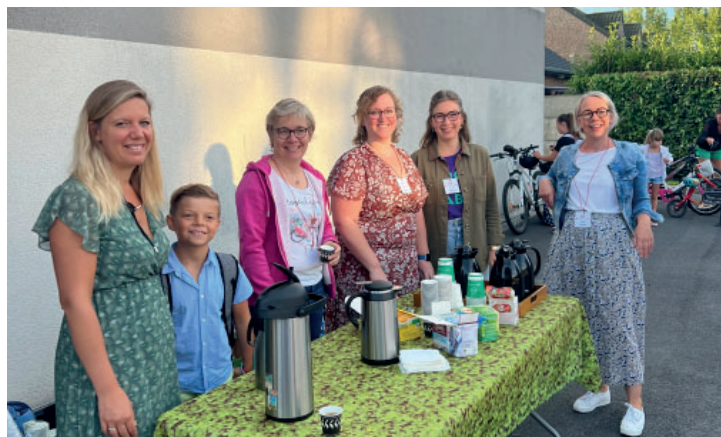
Rentrée des classes le 4 septembre avec accueil café par l'AIPE