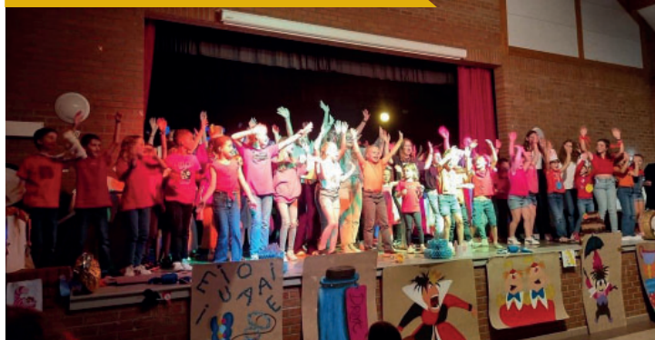
Fête du centre le 28 juillet