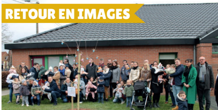
L'arbre des naissances organisé le samedi 4 mars mettant à l'honneur les 32 bébés nés en 2022