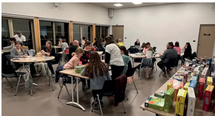
Soirée jeux de société le vendredi 17 mars animée par l'association «on fait un jeu ?!»