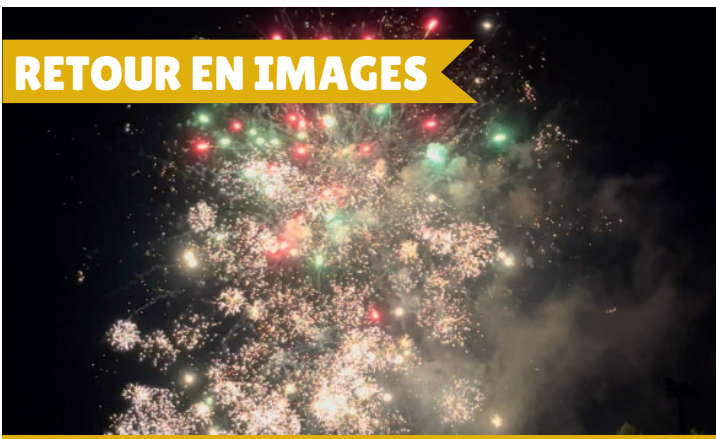
Le traditionnel feu d'artifice le mercredi 13 juillet à l'occasion de la Fête Nationale