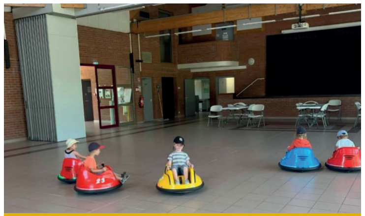
Dernière journée de centre aéré avec une grande fête foraine le vendredi 29 juillet