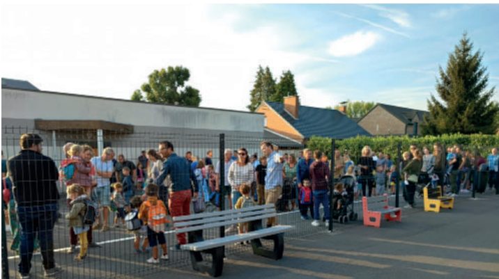
Rentrée des classes jeudi 1 er septembre pour les 225 élèves de l'école Daniel Devendeville