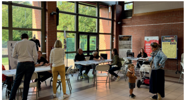
Forum des associations le samedi 10 septembre