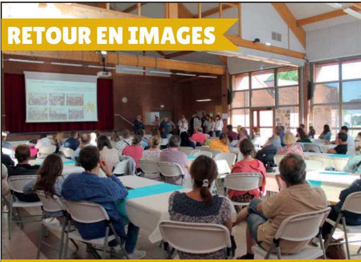
Accueil des nouveaux arrivants le vendredi 13 mai