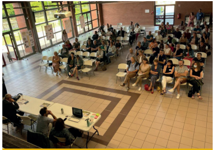
Présentation de l'étude cadre de Vie le samedi 14 mai