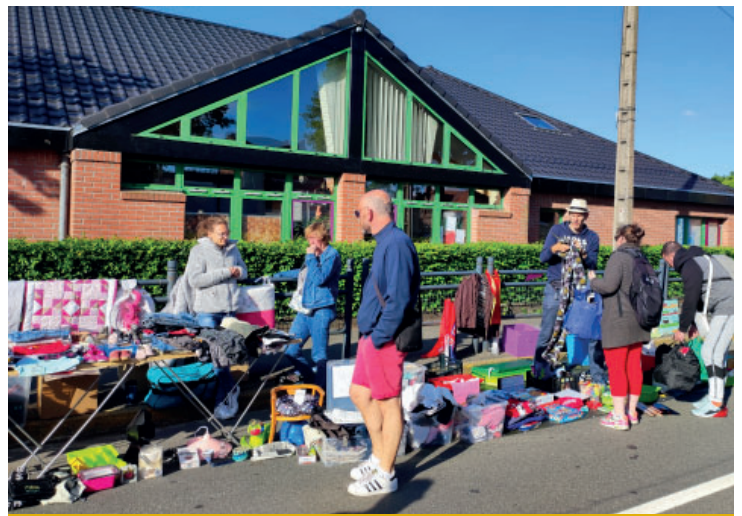
Marché aux puces