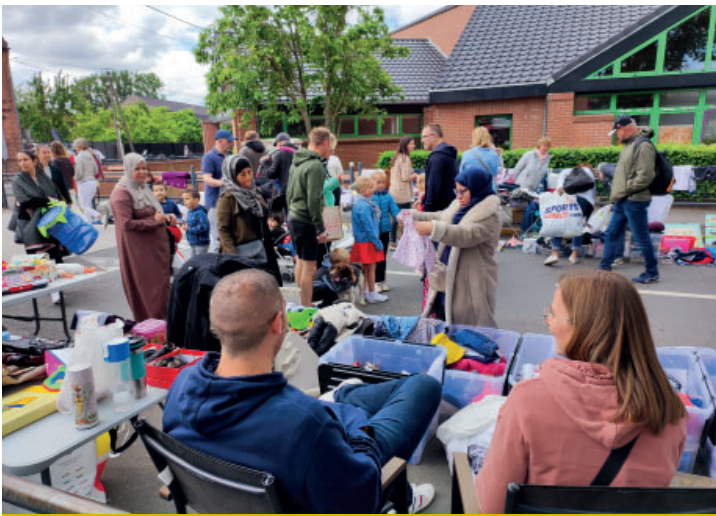
Marché aux puces du dimanche 29 mai